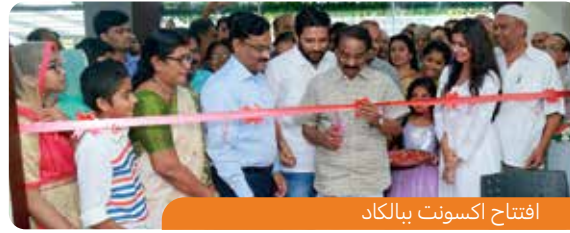
افتتاح أكسونت بيالكاد