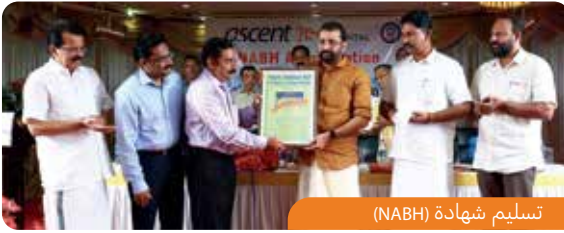
تسليم شهادة (NABH)