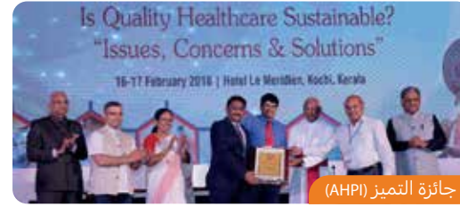
جائزة التميز (AHI)